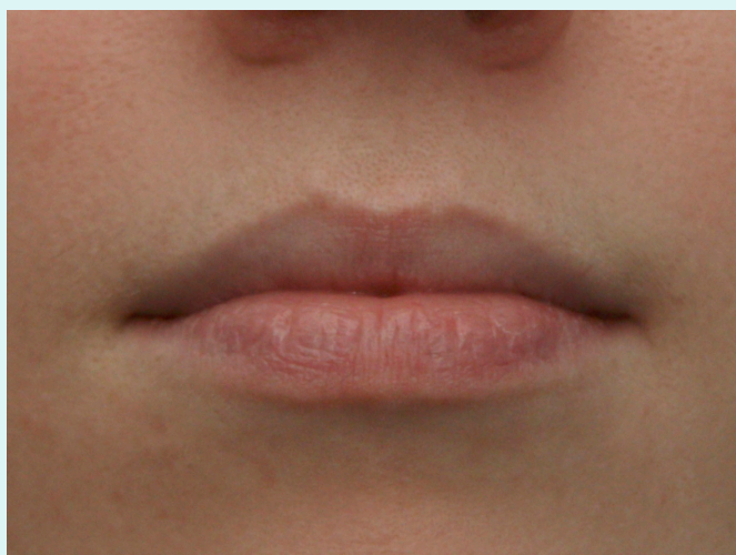
Mondbeeld p, b, m: de lippen op elkaar

Tijdens de training leert de slechthorende/plotsdove zien wat iemand zegt door het leren (her)kennen van de diverse mondbeelden. Klanken zijn van elkaar te onderscheiden omdat ze een ander mondbeeld hebben. Zo kan er bijvoorbeeld gezien worden of er in een woord een lipklank (p,b,m) gebruikt wordt, doordat het mondbeeld lippen op elkaar herkend wordt.